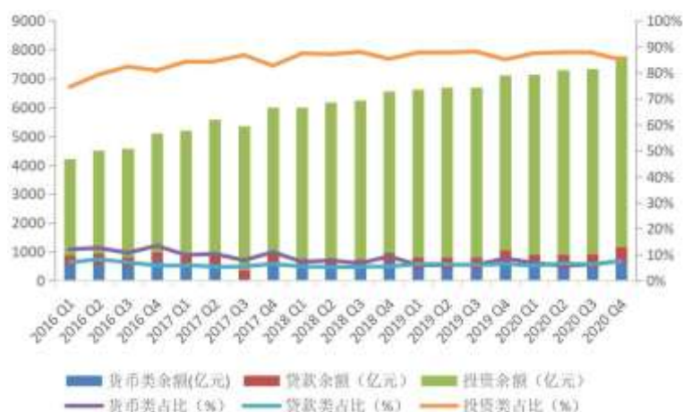
图 4 固有资产运用方式结构变化

从所有者权益的构成来看，截至 2020 年 4 季度末，实收资本为 3136.85 亿元，同比 2019 年 4 季度末 2842.40 亿元增长 10.36%。在 2020 年信托资产规模同比下降 5.17%的背景下，信托业资本实力增强，提升了部分信托公司应对风险的能力。当前，监管规定将信托业务开展规模限制和信托公司净资产挂钩，强大的资本实力不仅有利于扩大信托展业空间，而且提升了风险防范能力。2020 年相继有 12 家信托公司增资扩股，合计增资额为 266.48 亿元，高于 2018 年和 2019 年。