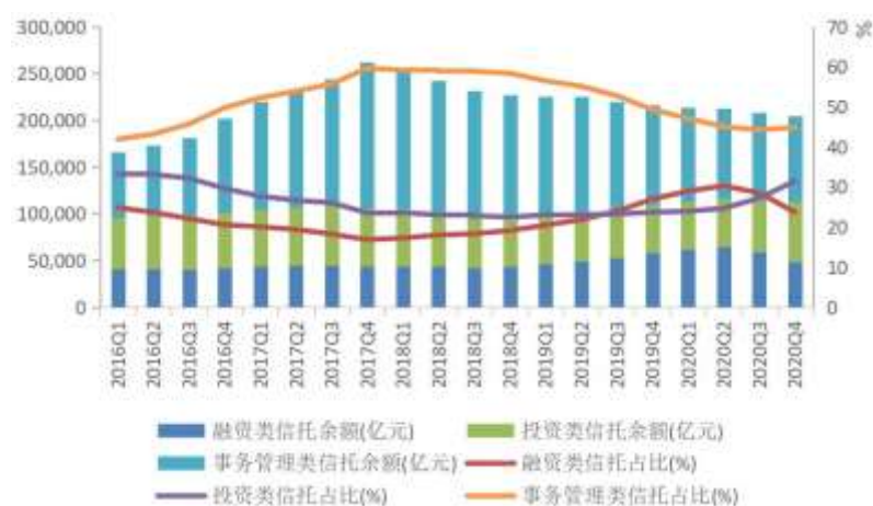
图3 信托资产按功能分类的规模与占比

大多数是以监管套利、隐匿风险为特征的金融同业通道业务。按照监管部门要求，事务管理类业务量与占比一直不断下降，金融机构之间多层嵌套、资金空转现象明显减少。