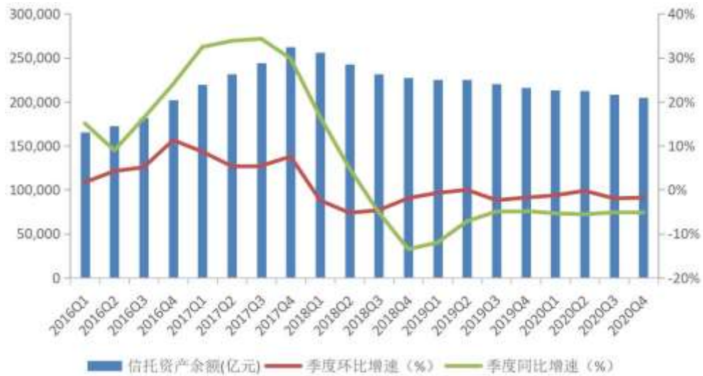
图1 信托资产规模变动情况

从资金来源看,截至2020年4季度末,集合信托规模为10.17万亿元,占比49.65%,同比上升3.72个百分点,比3季度末(49.42%)上升0.23个百分点。单一信托规模为6.13万亿元,占比29.94%,同比下降7.16个百分点,比3季度末(33.18%)下降3.24个百分点。管理财产信托为4.18万亿元,占比20.41%,同比上升3.44个百分点,比3季度末(17.41%)上升3个百分点。