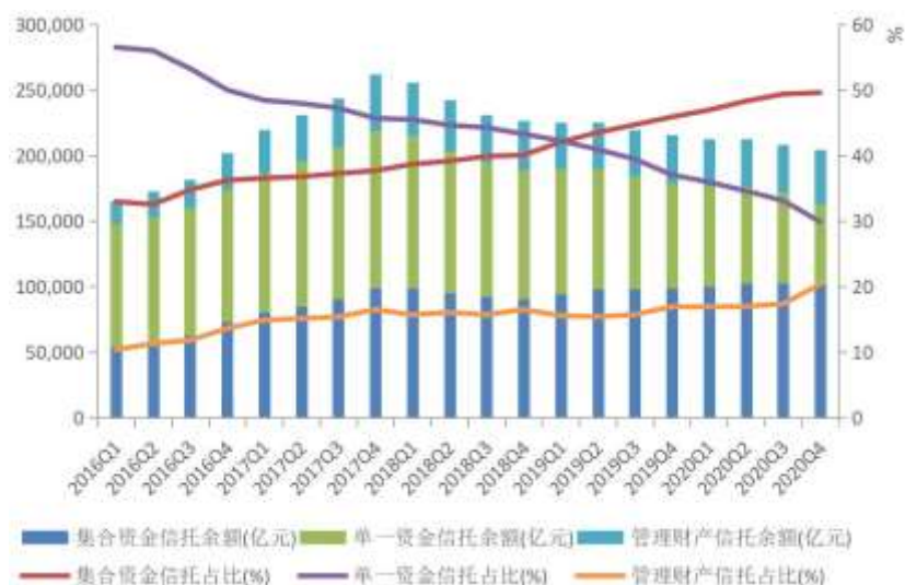
图 2 信托资产来源结构变动态势

信托资产规模下降的背后，与行业持续压降融资类和通道类业务有关。从长期来看，逐步压降融资类信托是信托公司回归本源的转型目标。但 2020 年上半年部分信托公司仍然迅猛发展，1 季度和 2 季度融资类信托资产分别为 6.18 万亿元和 6.45 万亿元，环比分别增加 3458.31 亿元和 2677.58 亿元，占比分别为 28.97%和 30.29%。对此，2020 年 6 月，银保监会下发《关于信托公司风险处置相关工作的通知》要求信托公司压降违法违规严重、投向不合规的融资类信托业务。