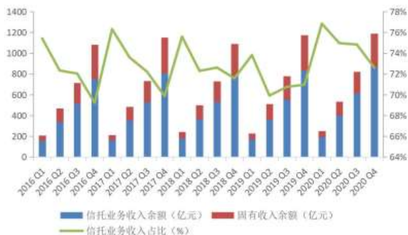
图5 信托业务收入及其同比增速变动

在经营收入中，2020年4季度末的投资收益为271亿元，同比下降2.18%。2020年4个季度的投资收入分别为45.16亿元、62.36亿元、60.17亿元和103.32亿元。4季度投资收益环比3季度增长71.71%，比3季度多43.15亿元。由于4季度投资收益比前3个季度大幅增加，使得4季度末的投资收益占比达到22.07%，虽然略低于2019年4季度末23.08%，但比前3个季度占比高得多。