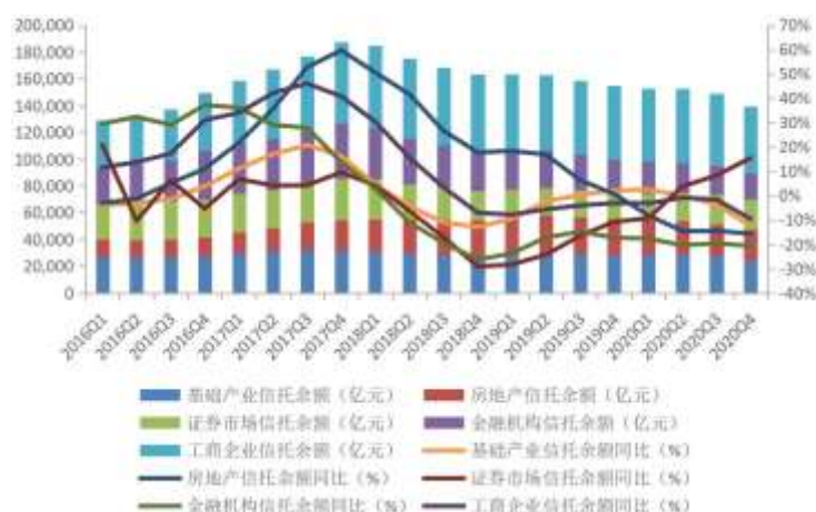
图7 信托资产按投向分类的规模及其增长情况

基础产业的投资是范围广、涉及面多，信托公司应深耕这一领域。我国已总结了新型基础设施建设的广泛内容，如加快第五代移动通信、工业互联网、大数据中心等建设，完善综合运输大通道、综合交通枢纽和物流网络，以及加快城市群和都市圈轨道交通网络化等一系列新的基础设施重点。新的基础设施建设领域不断涌现，信托业要积极作为，为国家重大基建项目提供资金，使资金信托发挥更大作用。