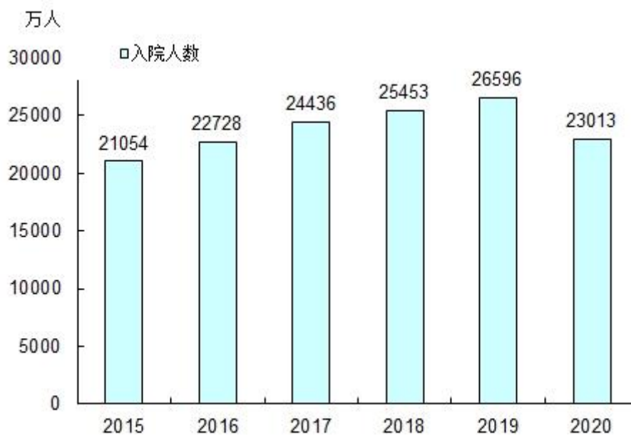
图5 全国医疗卫生机构住院量及增长速度

2020年，公立医院入院人数14835万人（占医院总数的80.8%），民营医院3517万人（占医院总数的19.2%）（见表5）。