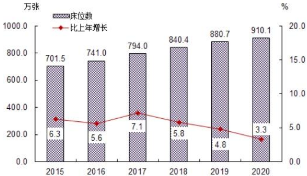
图2 全国医疗卫生机构床位数及增长速度

(三) 卫生人员总数。2020年末，全国卫生人员总数达1347.5万人，比上年增加54.7万人（增长4.2%）。