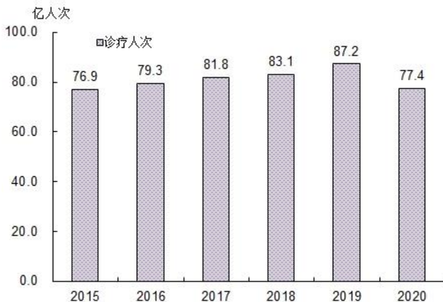
图4 全国医疗卫生机构门诊量及增长速度

2020 年公立医院诊疗人次 27.9 亿人次（占医院总数的 84.0%），民营医院 5.3 亿人次（占医院总数的 16.0%）（见表 5）。