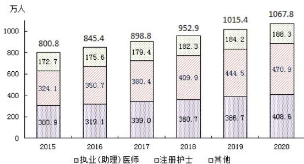
图3 全国卫生技术人员数